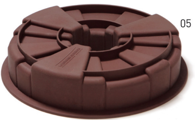
01 인앤아웃(Inandout)은 이름 그대로 안으로, 바깥으로 모두 활용이 가능한 제품이다 02 나이프와 포크, 스푼이 감각적으로 결합한 조인(Join) 03 다채로운 컬러가 시선을 사로잡는 노만 코펜하겐의 레인보우 트리벳(Rainbow Trivet) 04, 05 S-XL CAKE는 DING3000이 가장 사랑하는 제품 중 하나다